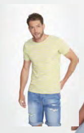
MILES MEN 01398